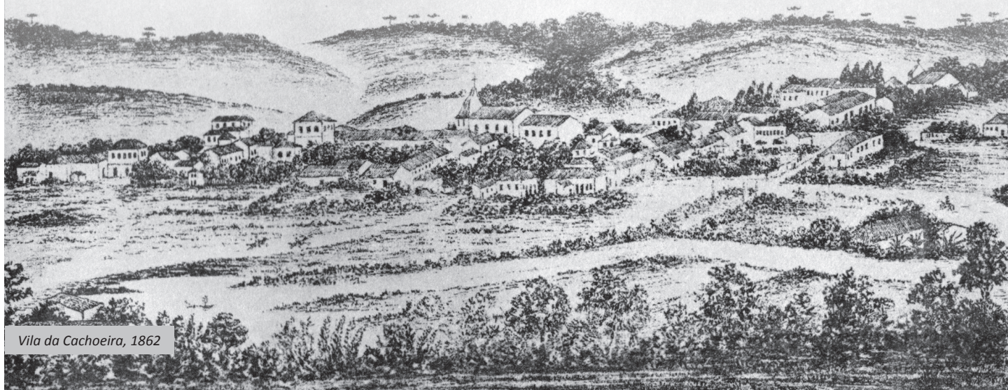
Vila da Cachoeira, 1862

Saiba como a pequena Vila da Cachoeira tornou-se município e conheça um pouco do contexto histórico do surgimento de nossa cidade no primeiro capítulo da série que contará a história de Cachoeira da Serra.