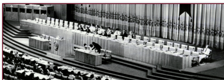
_Fig. 1 - Conferência de Alma-Ata, na antiga União Soviética, Organização Mundial da Saúde, 1978.

Assim, durante a Conferência que culminou com a Declaração de Alma-Ata, organizada pela OMS em 1978, na antiga União Soviética, a saúde foi reconhecida como direito fundamental das pessoas e comunidades, sendo enfatizado o acesso universal aos serviços de saúde e a intersectorialidade das ações, e ficando evidenciada a APS como estratégia básica para a consecução desses objetivos (MELLO, 2009). O lema Saúde para Todos no ano 2000 foi o mote das discussões, o qual seria alcançado pelo desenvolvimento da APS e seus princípios em todos os países do mundo. A Figura 1 a seguir traz uma imagem panorâmica da Conferência de Alma-Ata, em 1978.